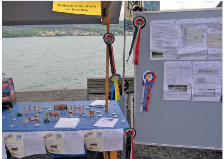
Der Info-Stand vom Reitverein machte gute Werbung.

Am Samstag, 27. August 2011, fand in der Seeanlage Meilen auch dieses Jahr der Neuzuzügeranlass Meilen statt. Nach der traditionellen Fährenfahrt konnten sich die Meilemer an diversen Marktständen über das Geschehen im Dorf sowie diversen Vereinsaktivitäten informieren. Diese Gelegenheit nutzen auch wir, machten mit diversen Flyern und Postern Mitglieder- sowie Juniorenwerbung und stellten an einer prominenten