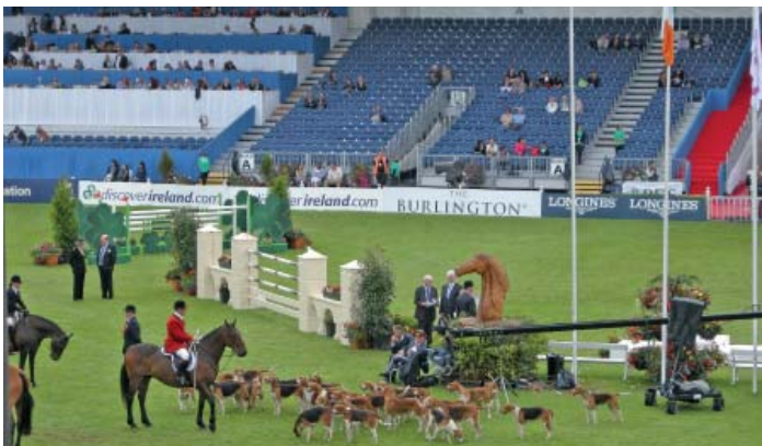
Die Vorführung einer Jagdhunde-Meute durfte selbstverständlich auch nicht fehlen.