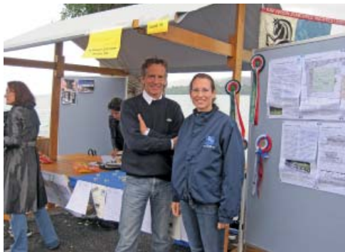
Trotz schlechtem Wetter, strahlende Standbetreuer!

Bei extrem herbstlichen Temperaturen und immer stärker werdendem Regen froren sowohl