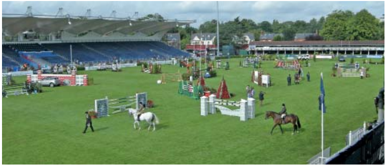
In der Hauptarena wurde zwischen den Springprüfungen auch ein abwechslungsreiches Showprogramm geboten.