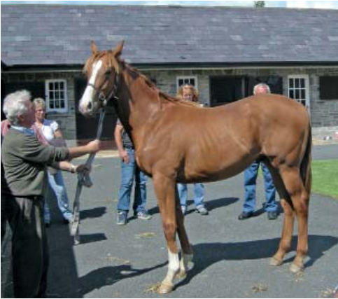
Ein wertvoller Vollblüter aus der Zucht von Moyglare Stud.

Mittagessen im betriebseigenen Restaurant, noch einem kleinen Abschluss-Springen von einem Jugend-Ferien-Reitlager beiwohnen. Diese Mädchen und Knaben verbrachten zwei Wochen von ihren Ferien auf diesem Ausbildungsbetrieb und erhielten neben dem Reitunterricht jeweils am Nachmittag auch noch Englisch-Sprachunterricht. Auf dieser Anlage, mit einer grossen Halle und verschiedenen Aussenplätzen, kann man sich für Trainings von praktisch allen Schwierigkeitsgraden anmelden. Mit Stalungen für mehr als 100 Boxen ist das Equestrian Centre auch für grosse, nationale Turniere gerüstet.