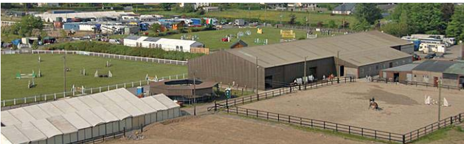
Das Equestrian Centre Mullingar mit seinen Aussenplätzen.

Auf dem Weg zurück nach Dublin wurde noch ein kurzer Besuch bei einem Trainer von Vollblütern gemacht. Dabei ist immer wieder interessant, wie jeder Trainer seine eigene Futterzu-