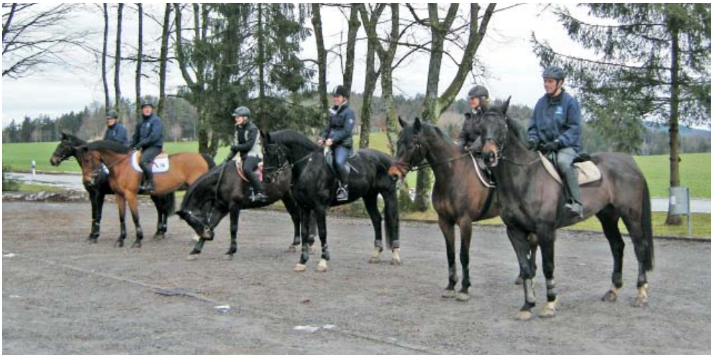
Nach einigen Jahren wieder ein «Bächtelisritt»! Es wurde nicht nur diszipliniert geritten, sondern auch beim Bügeltrunk herrschte Ordnung bei Pferden und ReiterInnen!!!