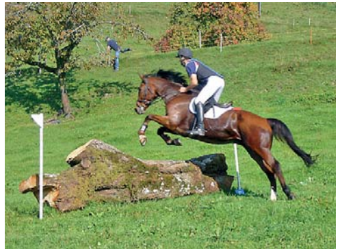
Anspruchsvoll, aber schöne Geländestrecke.

Leider sind von den Teilnehmern des Reitvereins Zürichsee rechtes Ufer keine Fotos vorhanden, deshalb einige Bilder von Mitgliedern des Reitvereins vom Kempthal.