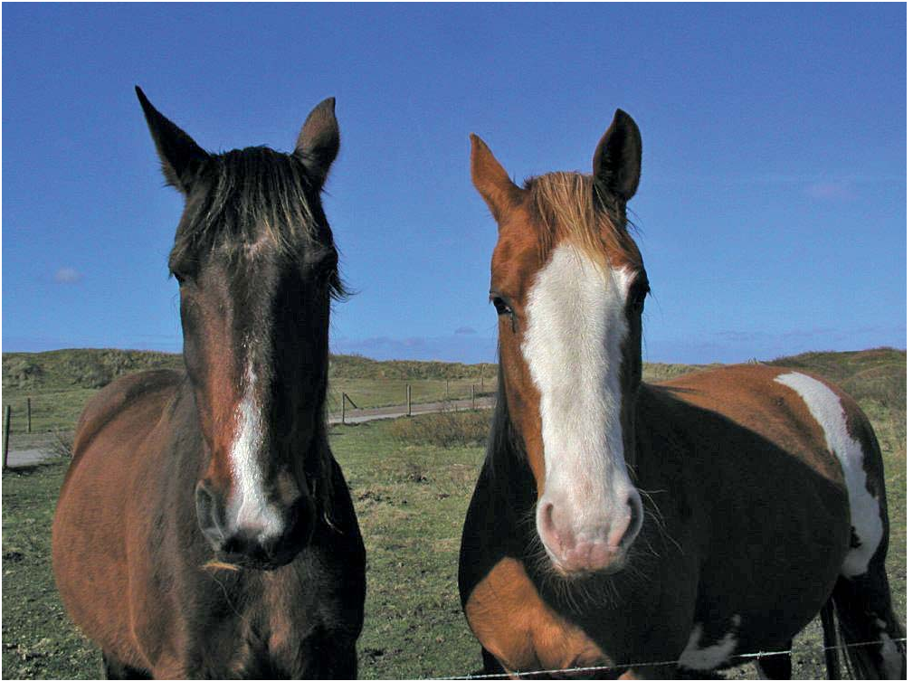
Zwei gute Freunde.