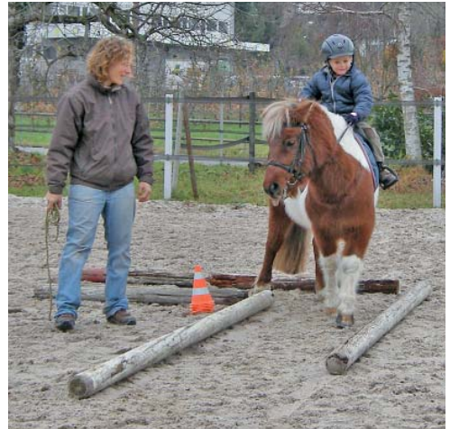
Jeder will es am Besten machen!