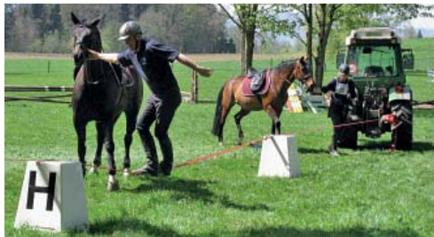
Postenarbeit auf dem Springplatz am Patrouillenritt 2011.