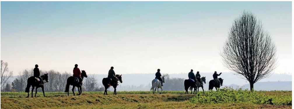
Es könnte an unserem Herbstritt gewesen sein!