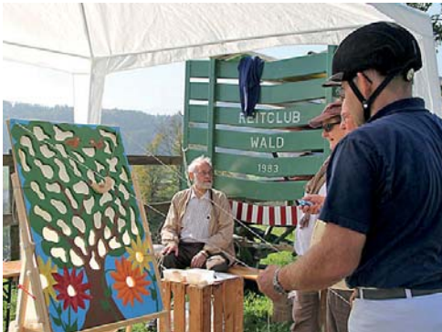
Postenarbeit, welche eine ruhige Hand verlangte.