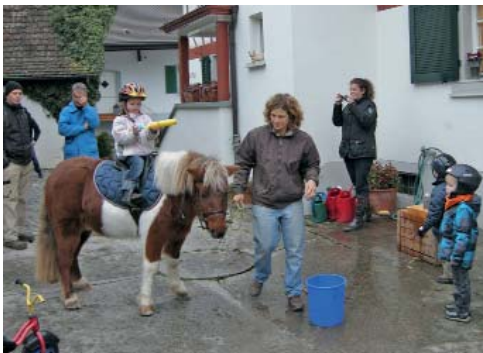
Kerzenlöschen mit der Wasserspritze auf dem Rücken von «Schmidi» war sehr beliebt.

Zum Jahresabschluss haben die fünf dann einen richtigen Parcours absolviert, wo alles Gelernte spielerisch noch einmal richtig zum Einsatz kam – besonders viel Spass hat dabei das Büchschenschiessen und Kerzenlöschen mittels Wasserspritzpistole «hoch zu Ross» gemacht. Als es dann noch eine Medaille, einen feinen Apfelpunsch und ein Überraschungsei für jeden gab, waren alle rundum glücklich! Ein gelungener Abschluss nach einem schönen Jahr – wir freuen uns schon alle auf die Montage im neuen Jahr!