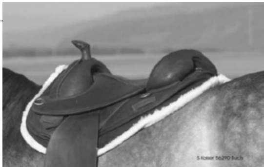
S. Koller 56290 Buch